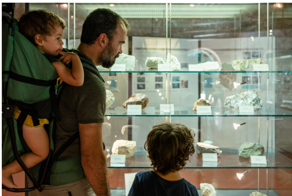
Nella foto a fianco Una famiglia in visita alla sezione dei minerali all'interno del museo del Temperino, nel parco Archeominerario di San Silvestro.

Parchi e musei della Val di Cornia aderiscono alla Giornata Nazionale offrendo il meglio per accogliere le famiglie con un calendario ricco di appuntamenti