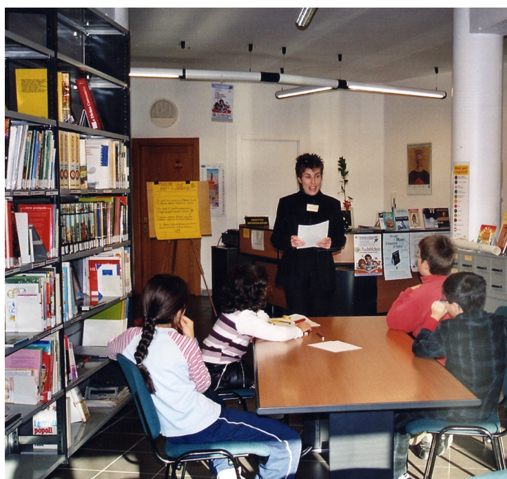
Nella foto a fianco e sotto, due vecchie immagini della biblioteca "R. Fucini" nel 2004, mentre era in corso un laboratorio di lettura e scrittura per bambini.

Con la ristrutturazione cambia la collocazione degli arredi per ricavare una saletta che consentirà di ottimizzare la capienza massima di utenti della biblioteca.