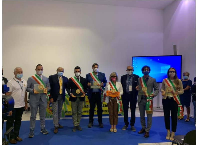
Nelle foto la cerimonia di consegna delle Bandiere Gialle alcuni camper all'ingresso dell'area Fiere di Parma